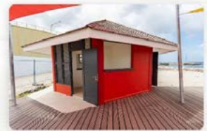
Ingang - Bar